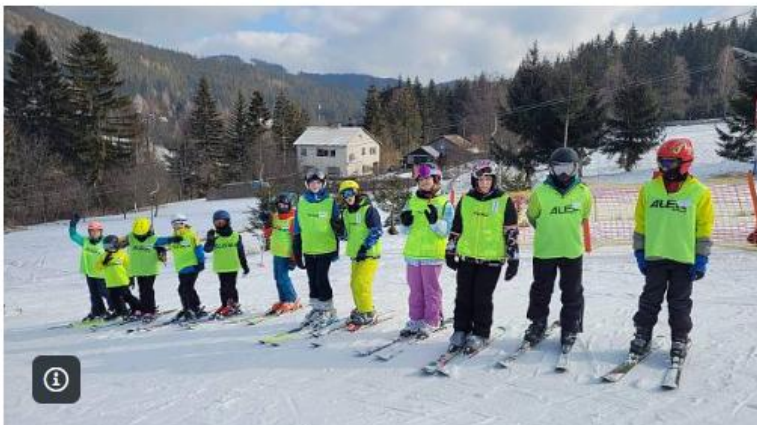
Během jarních prázdnin vyrazily děti z hranického Domečku tradičně na hory.