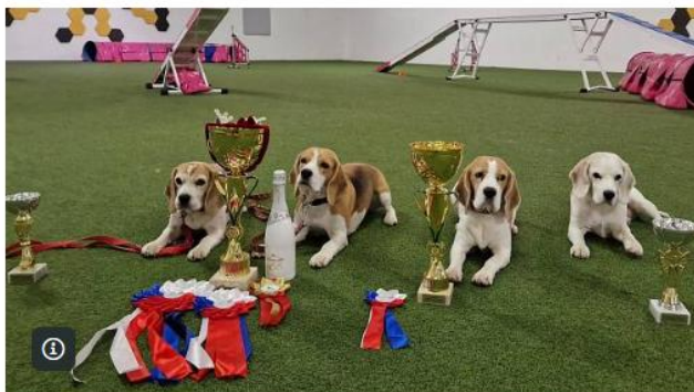
Týmu Agility Hranice se během podzimu dařilo